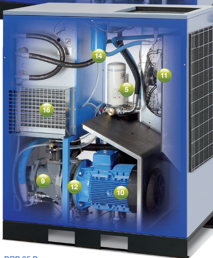
DRB 35 D