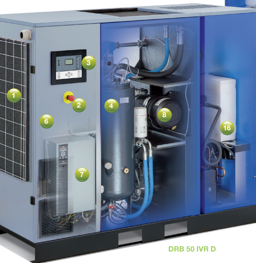
DRB 50 IVR D